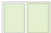
1/1 Seite Preis: 716,00