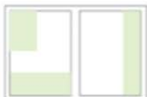
1/4 Seite hoch oder quer Varianten Preis: 179,00

Heftformat 225 x 297 mm Satzspiegel 196 x 264 mm