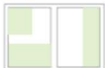
1/3 Seite hoch oder quer Varianten Preis: 238,00