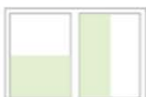
1/2 Seite hoch oder quer Preis: 358,00