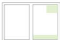
1/8 Seite hoch oder quer Varianten Preis: 89,00

Heftformat 225 x 297 mm Satzspiegel 196 x 264 mm